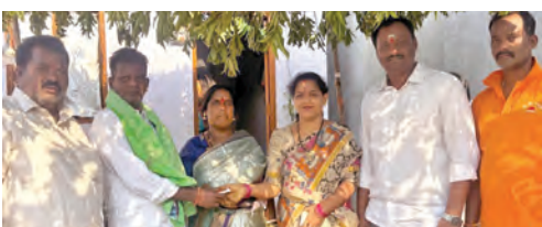
సహాయ అంధజేస్తున్న కౌన్సిలర్ ఆర్చన

శ్రీవారి ఆలయ అభివృద్ధికి సహకారం చాచి శ్రీ వెంకటేశ్వరస్వామి ఆలయ అభివృద్ధికి దాతలు సహకరించడం అభినందనీయమని ఆలయ పౌడర్ బిచ్చుపు అన్నారు. భాంజాపూర్ గుట్ట సమీపంలోని శ్రీ వెంకటేశ్వర స్వామి ఆలయ సన్నిధిలో డబుల్ డెడ్ రోడ్డు కాంట్రాక్టర్ల అవసరాలకై, ఆశీస్సులు నిమోదించి వెడలిపోయారు. ఈ సందర్భంగా ఆలయ పౌడర్ బిచ్చుపు మాట్లాడుతూ ఆలయ అభివృద్ధి గ్రామ జనాభా ప్రతిభగా నిలుస్తుందని అన్నారు. దాతల సహకారంతో ఆలయానికి కొత్త వెలుగులు రానున్నాయన్నారు. మరింతమంది దాతలు సహజనీకులు, ఆలయాల అభివృద్ధికి ముందుకు రావాలని పిలుపునిచ్చారు.