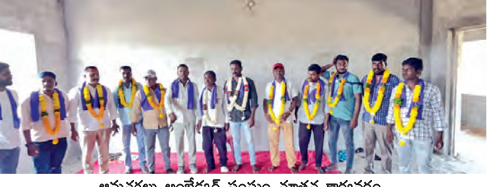
అమనగల్లు అంబేద్కర్ సంఘం నూతన కార్యవర్గం